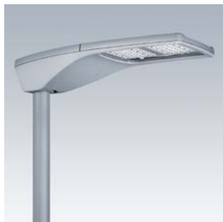
R2L2 M de 9500 lm a 33 800 lm

PARA OFRECER UN RENDIMIENTO LUMÍNICO EXCELENTE Y CUBRIR TODAS LAS APLICACIONES EN LAS CALLES Y CARRETERAS.