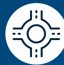
VÍAS PEATONALES/ ROTONDAS