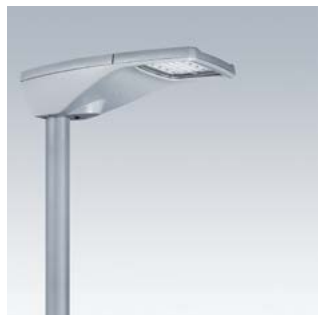
R2L2 S de 2000 lm a 14 500 lm