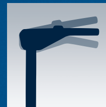
AJUSTES DE INCLINACIÓN