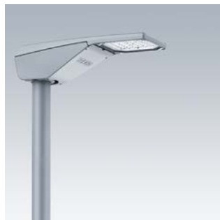
R2L2 XS de 1900 lm a 13 000 lm